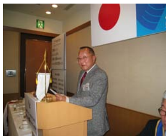
小池10周年実行委員長