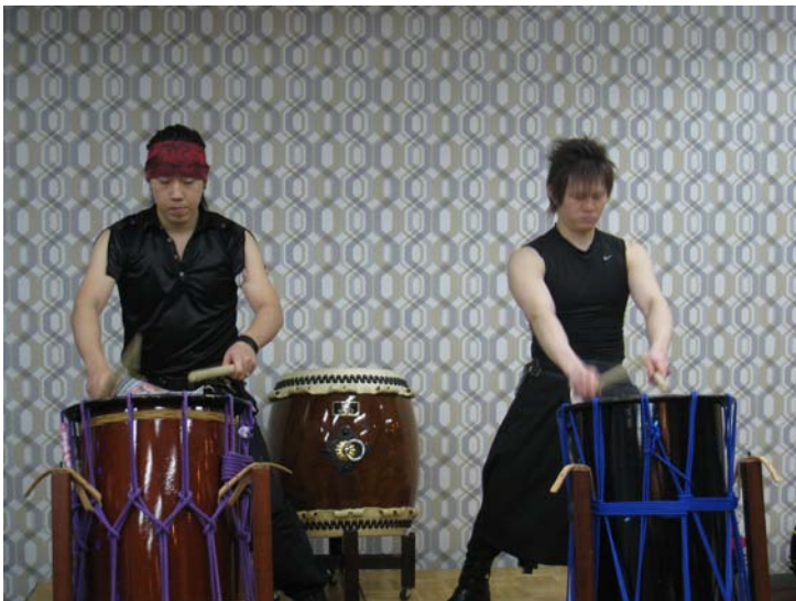
和太鼓 パフォーマンス ♪ 刹那 ♪